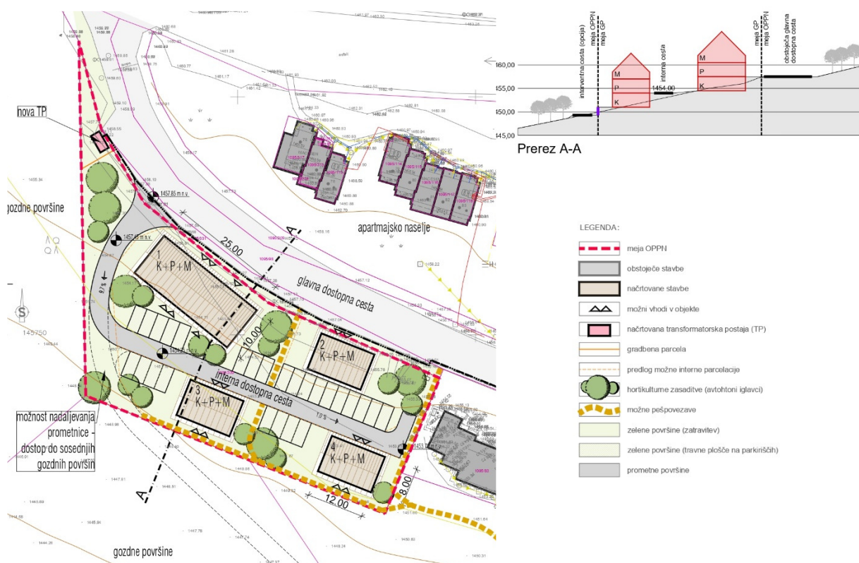
Slika 2: Prikaz območja OPPN z legendo in prerezom

Dostop do območja se uredi direktno iz nekategorizirane glavne dostopne ceste. Parkirišča se zagotovijo v sklopu gradbene parcele vzdolž interne dostopne ceste.